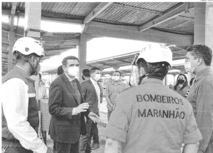
Equipe da Defesa Civil e o juiz Douglas Martins durante a vistoria realizada nesta segunda, 22, no Terminal de Integração da Praia Grande