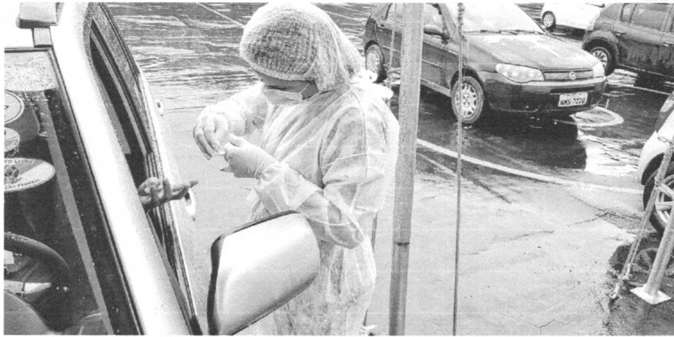
Profissional de saúde coleta sangue para fazer exame no drive thru instalado no Complexo Castelão; testagem nos mesmos moldes também é realizada no Parque do Rangedor

Capital e Interior R$ 2,00 Outros estados R$ 4,00