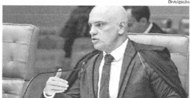
Ministro Alexandre de Moraes considera decisão da Câmara um marco

O ministro Alexandre de Moraes, do Supremo Tribunal Federal, disse ontem que a confirmação da ordem de prisão do deputado bolsonarista Daniel Silveira (PST-RR) nos plenários da própria Corte e da Câmara dos Deputados foi um "marco no combate ao extremismo antidemocrático". "O incentivo a dar surras em ministros do Supremo Tribunal Federal, o incentivo a agressões contra a saúde e vida de ministros do Supremo Tribunal Federal, o incentivo à ditadura e ao AI-5 que fecha o Supremo Tribunal Federal não são críticas, são atentados contra a democracia", disse.